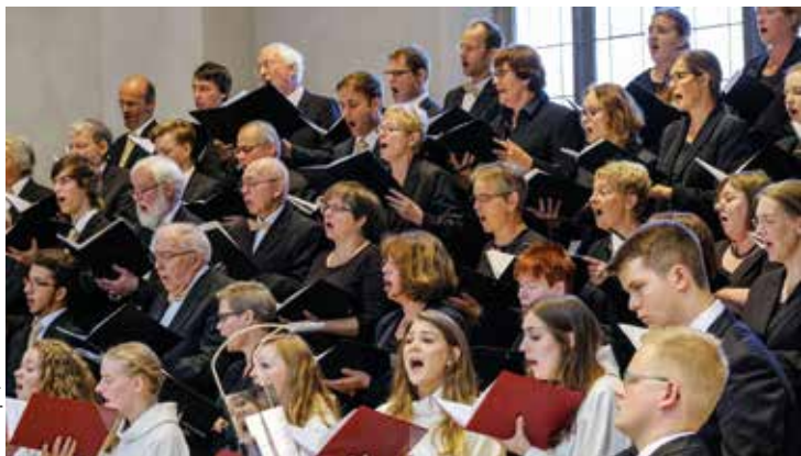
Chöre bei der Bischofsweihe am 1. September 2018